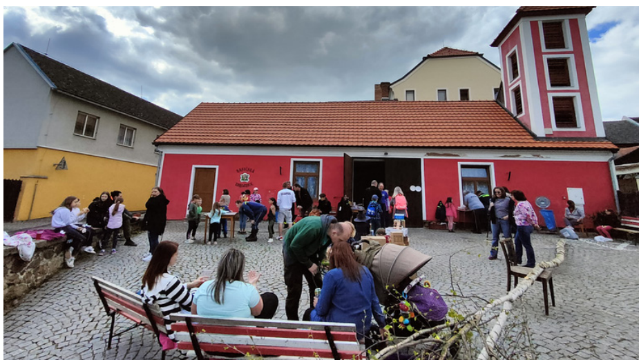
Husinečtí hasiči připravili již potřetí stavění májky spojené se soutěžemi pro děti. V podvečer zahrála country kapela.