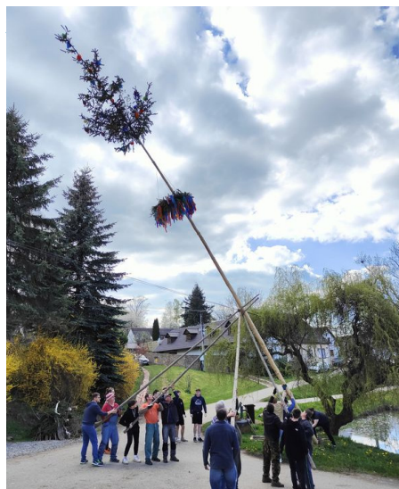
Tradiční stavění májky ve Výrově.