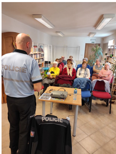
Beseda s policií ČR o současných technikách podvodníků.