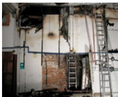
Požár pily v Podedvorech

Naposledy, když se zvedla řeka a pustili jsme houkačku,