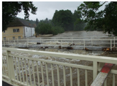
Povodně v roce 2002

Nejhorší zásahy jsou u smrtelných úrazů. Pády z výšek.