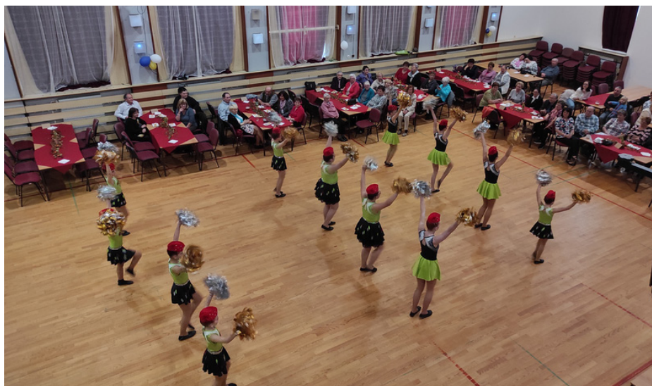
Tradiční setkání seniorů v kulturním domě. Velkou radost udělaly svým zpěvem děti ze ZŠ a vystoupení mažoretek.