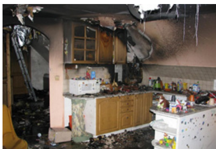
Požár střechy v Husinci.

A jak se k vám chovají profesionální hasiči, když se sejdete u zásahu?