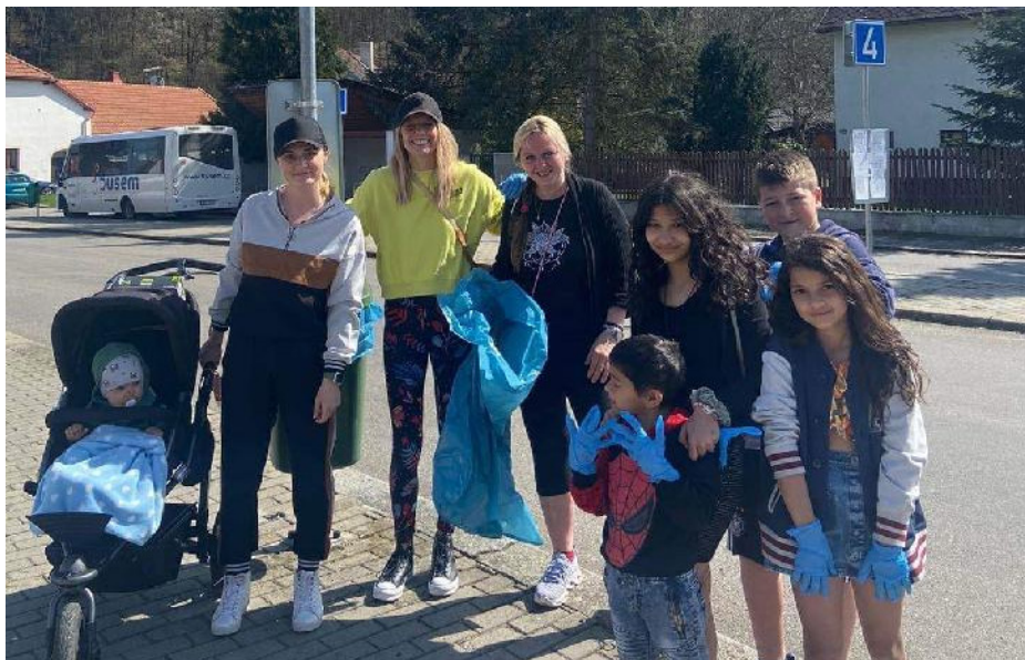
Den Země - krásné počasí a hrstka nadšenců běhajících po Husinci s modrými pytlí. Závěr - peční buřtů a hraní her.